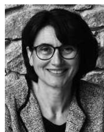
Olivier KLEIN Ministre délégué de la Ville et du Logement